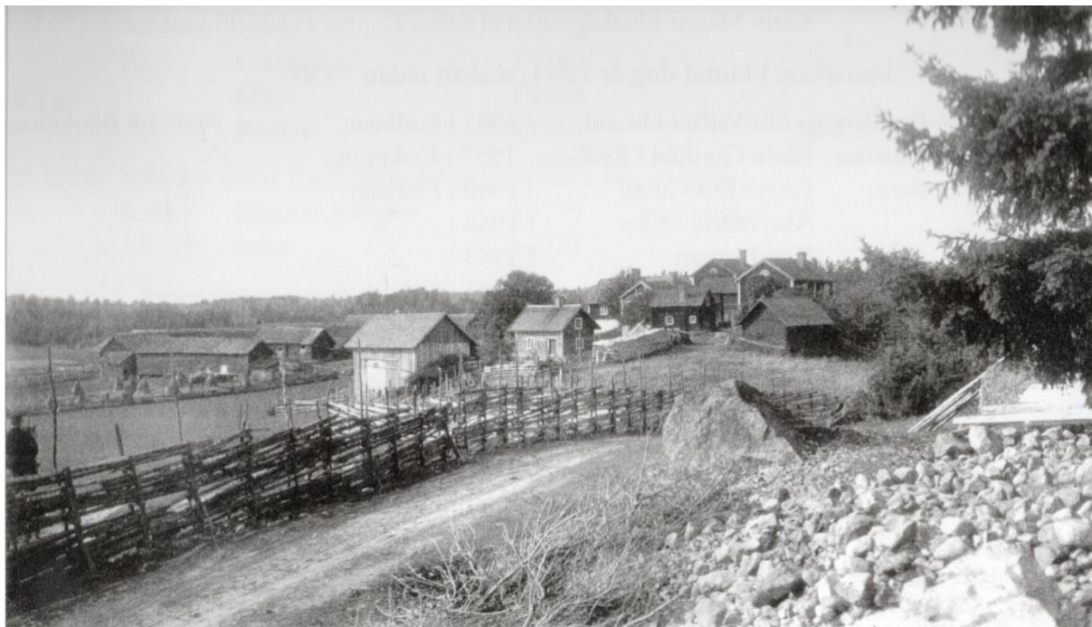
Tråstorp i mitten av 1890-talet, ännu ganska orörd sedan storskiftets dagar och den förödande branden år 1796. Till vänster i bilden de gamla ladugårdarna i vinkel med varandra.

Byn Tråstorp har – i likhet med flera byar i Vårdnäs socken – sitt ursprung i medeltiden. Bygdeforskaren och folkskolläraren Paul Anieström 1 kallar Tråstorp ”en mycket gammal by”; 1300-talet har nämnts. Utanför bykärnan är Furusten från omkring 1690, den äldsta kända bosättningen inom Tråstorps skifteslag. Äldsta kända fornfynd i Tråstorp är en stenypa, typ hacka från tidig bronsålder, ca 1800 f. Kr.