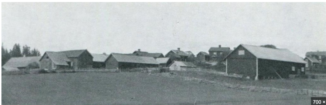
Tråstorp omkring 1910